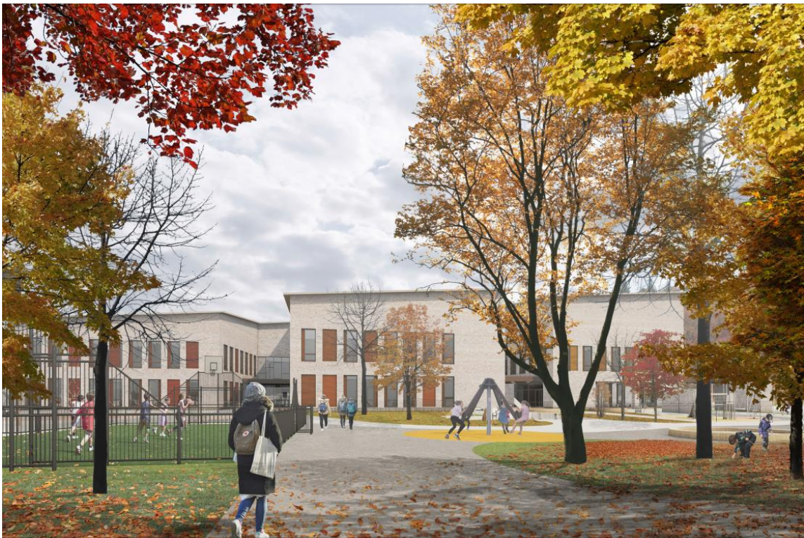
Havainnekuva Gesterbyn koulusta

Kunnanjohtajan esitys Kunnanhallitukselle 3.11.2022