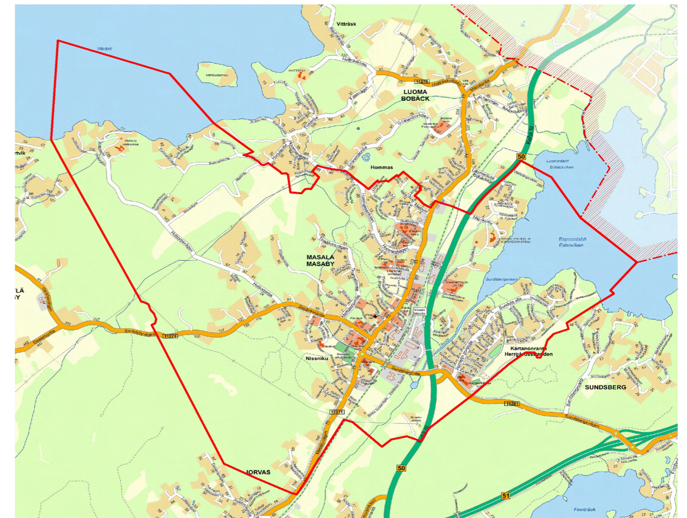
Masalan osayleiskaava-alueen rajaus