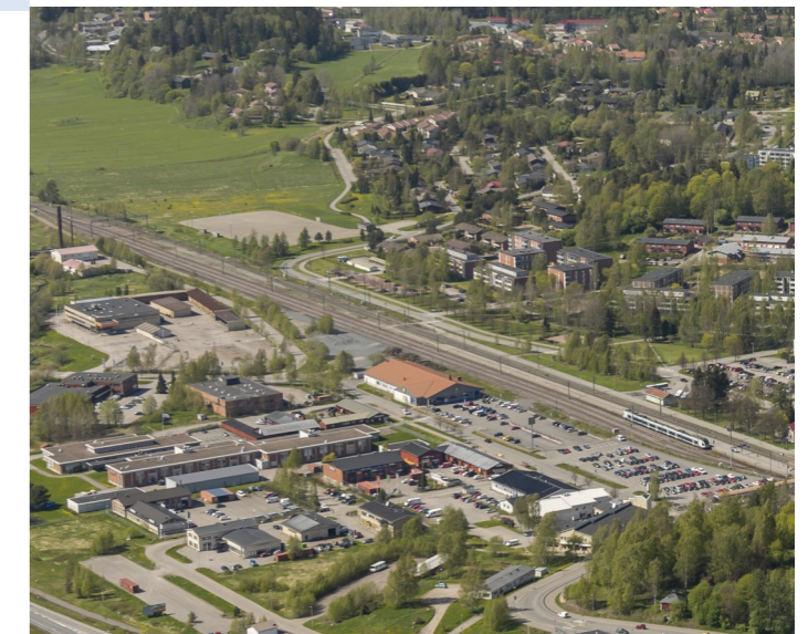
Viistoilmakuva Munkinmäelle kaakosta.