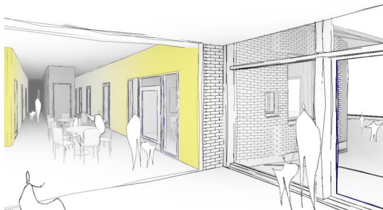
Näkymä yhdysaulasta mahdollisen uuden laajennuksen suuntaan

Neurolan lastenvaunu säilytys tulee ratkaista sisäänkäynnin yhteyteen.