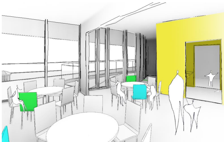
Näkymä ryhmätilasta pesuhuoneen läpi toiseen ryhmätilaan (leikki-lepo)