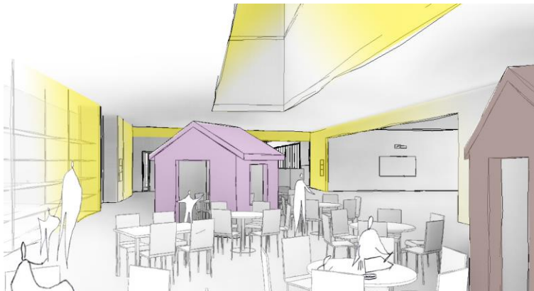
Näkymä keskustorilta oppimispöppien kohdalta; vasemmalla kuvaamataidon vitriinit, oikealla muuntuvia OT3 (60m 2 ) tiloja

Aineenopetuksen ns. perustilojen tarve on Veikkolan koulussa suuri. Hankesuunnitelmassa yleisopetustilaa on sijoitettu yhtenäiseen keskustori-nimikkeellä kulkevaan tilaan keskeisesti koko rakennukseen nähden. Hankesuunnitelmassa keskustori sijoittuu uuden ja vanhan rakennuksen liitoskohtaan. Keskustorin alueelle voi sijoittaa monenlaisia muunneltavia oppimispisteitä, sähköisen työskentelyn pisteitä ja koulukirjasto-osasto. Rauhalliset työskentelyopet ja mukautuvat työskentelypisteet järjestetään kiinto- ja/tai irtokalusteilla. Keskustori hankesuunnitelmassa nivoutuu kiinteästi Veikkolan nykyisen koulun säilytettävään ATK-tilaan. Keskustoria palvelee wc-tilojen rykelmä keskeisesti tiloihin nähden – oppilaiden ei tarvitse siirtyä sisääntulojen wc-tiloihin. Tässä on esitetty sijoitettavaksi myös esteetön wc-tila.