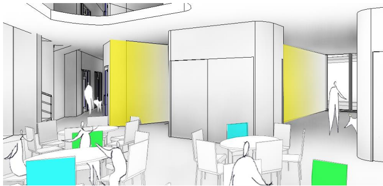
Näkymä monitoimisalista ruokailun aikana

Sali-monitoimitila on rakennuksen isoin kokoontumistila. Tila voidaan jakaa kahteen erilliseen osaan. Salissa tapahtuu myös päiväkodin vanhimpien lasten ja esikoululaisten päivittäinen ruokailu.