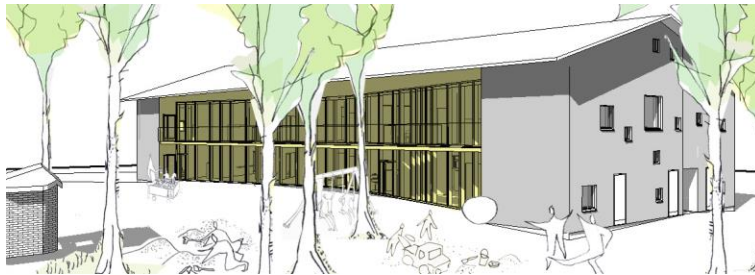
Näkymä päiväkodin pihalta uuden 2-kerroksisen rakennukseen suuntaan