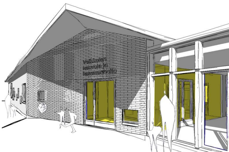
Näkymä mahdollisen uuden rakennuksen sisääntulosta, oikealle sijoittuu yhdysaula nykyisen koulun suuntaan