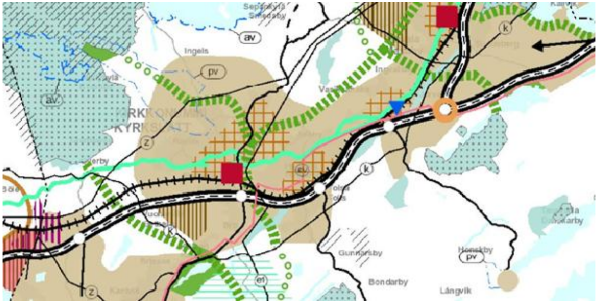
Ote Uudenmaan maakuntakaavojen yhdistelmästä