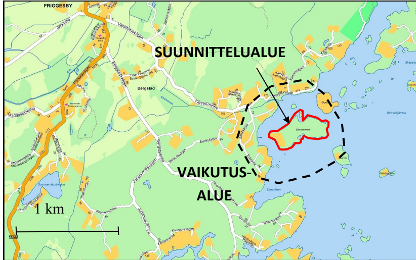
Ranta-asemakaava-alueen ja sen vaikutusalueen alustava rajaus