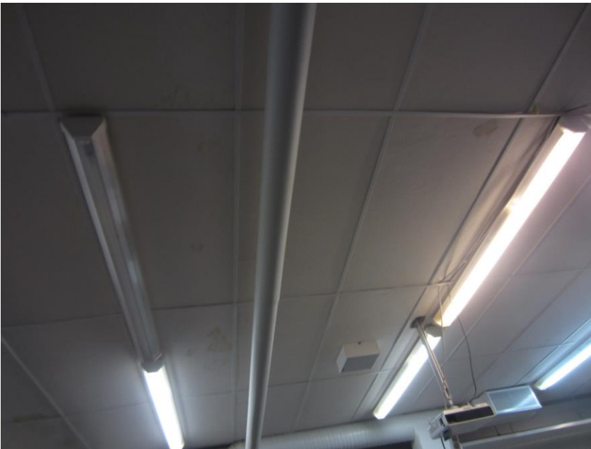
Teknisessä luokassa oli kattopaneeleissa kosteusläikkiä