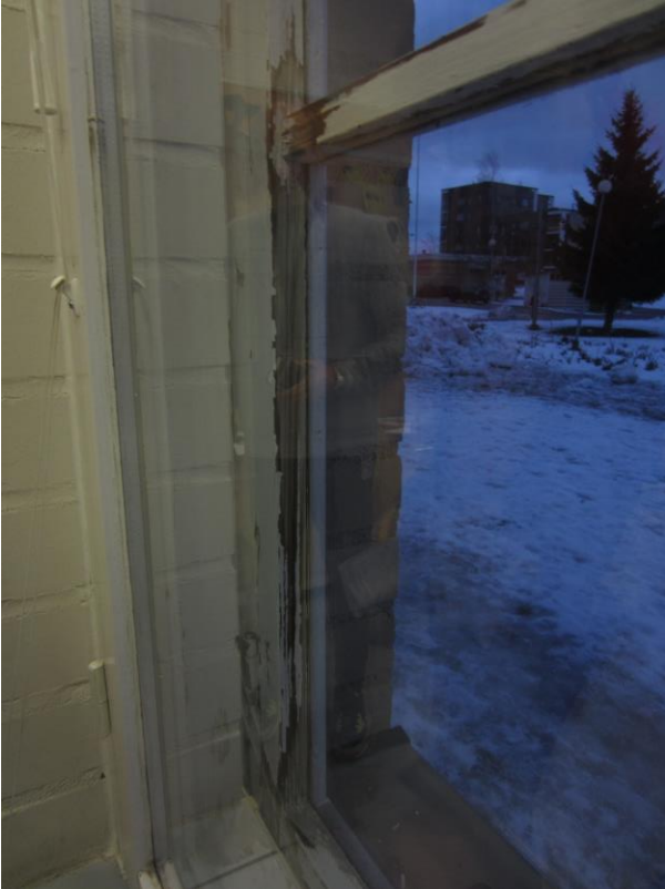
Luokan 135 ikkunoista tulee vedet sisälle