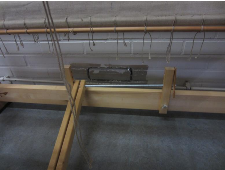
137 luokan ulkoseinässä oli tiili irti