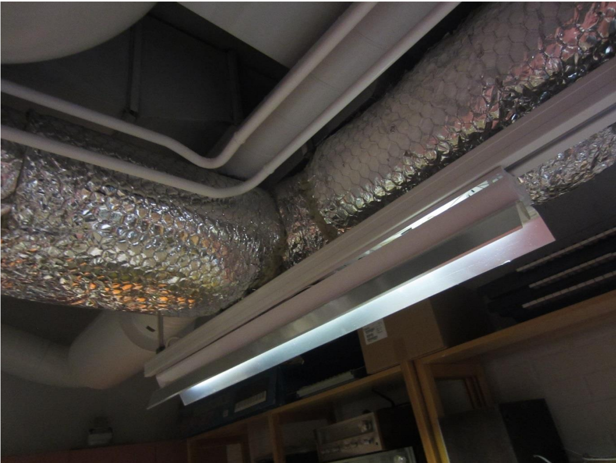
Musiikkiluokan varaston ilmanvaihtokanavissa oli mineraalivilla näkyvillä