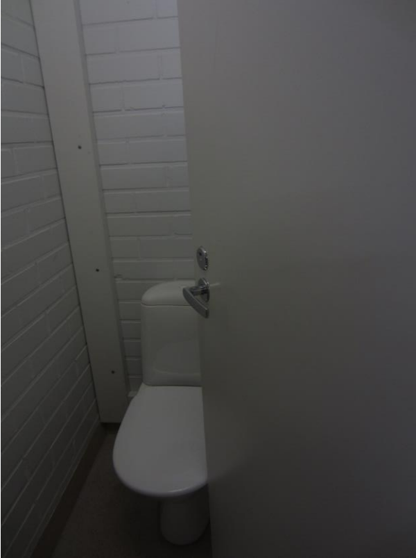
Tyttöjen pukuhuoneen WC:n ovi ei mahdu aukeamaan kunnolla