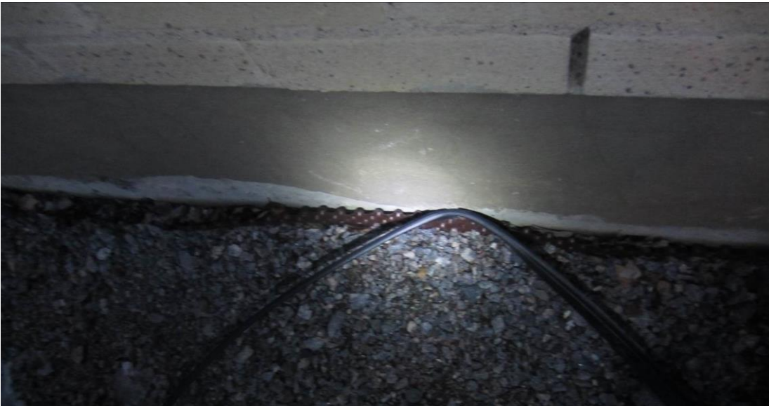
Patolevyn irronnutta listaa