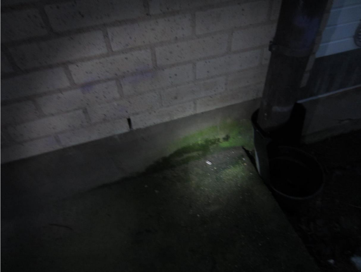
Sadevesi on kastellut sokkelia