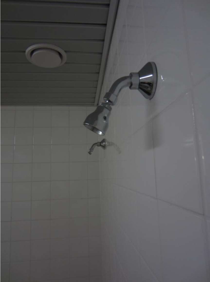
Suihkusta puuttuu suutin (tyttöjen pukuhuone)