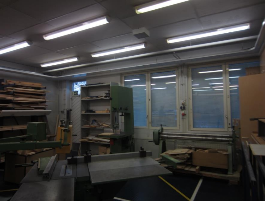
Puuvarasto/konehuone 137: Pölynpoistomuri heittää takaisin sisäilmaan puupölyä