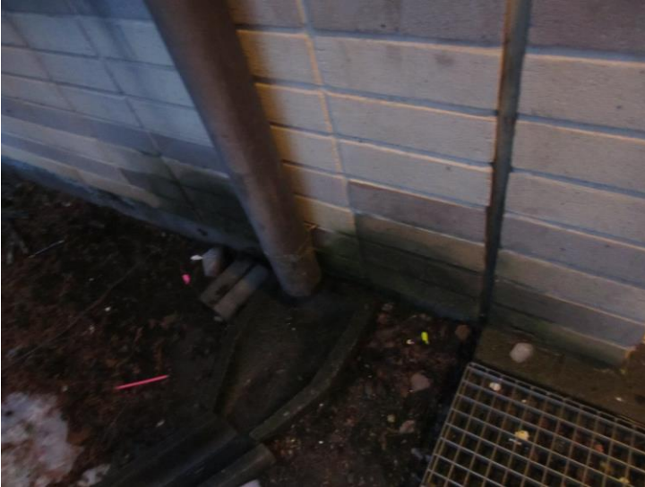
Sadevesiränni on kastellut seinää