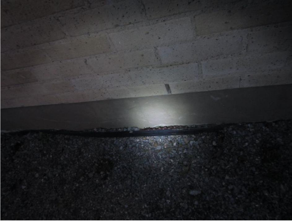
Maa-ainesta on päässyt sokkelin ja patolevyn väliin