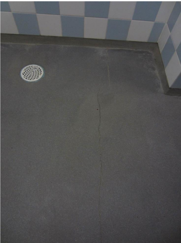
Pukuhuoneen liikuntasalin lattiassa on halkeilua