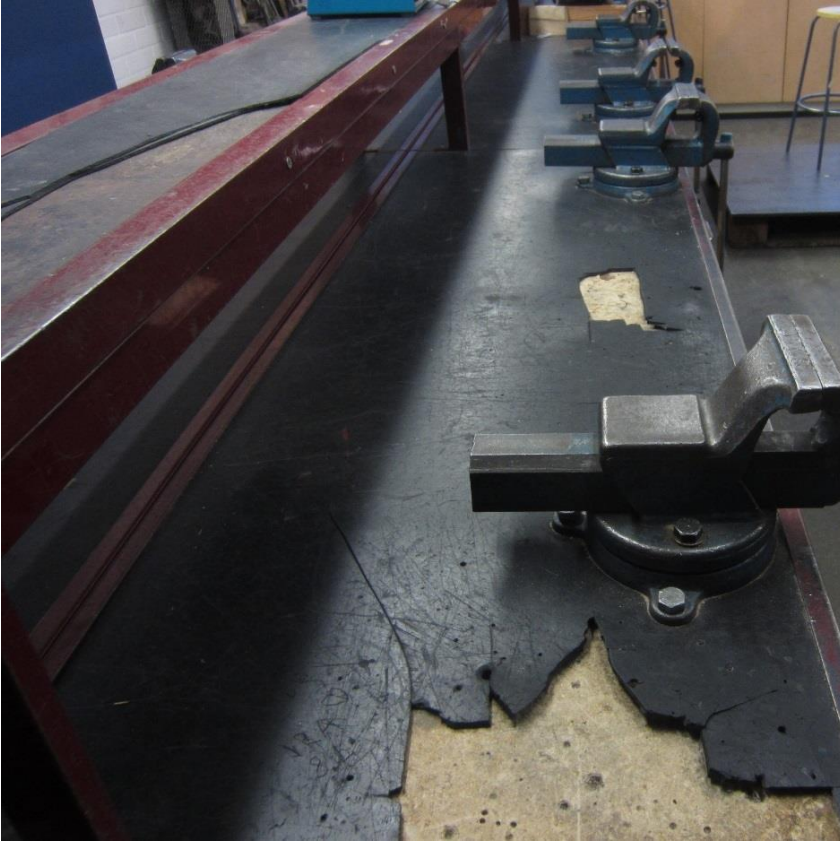
Teknisessä tilassa työpintoja oli rikki