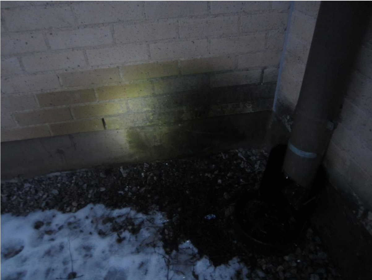
Nurkka oli kastunut