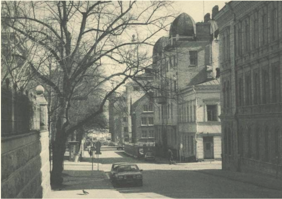
KIRKKOKATU, KRUUNUHAKA, 1980 / PENTTI SAMMALLAHTI