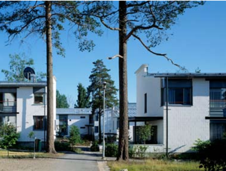
Köökarinkuja 7, Arkkitehdit