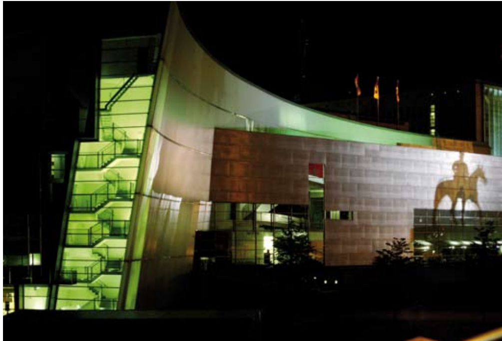
Kiasma, arkkitehti Steven Holl, 1998. Ari Leppä

suutta. Monotonisuuden sijaan haetaan osa-alueiden identiteettiä. Innovatiiviset ratkaisut ammentavat myös perinteestä. Kaupunkilainen ei tyydy ylhäältä tarjottuun. Tarvitaan vaihtoehtoja ja luovaa keskustelua.