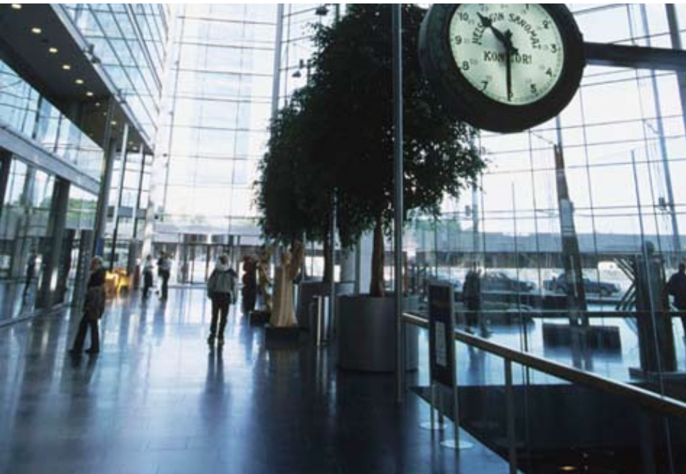
Sanomatalo, Arkkitehtitoimisto SARC, 1999