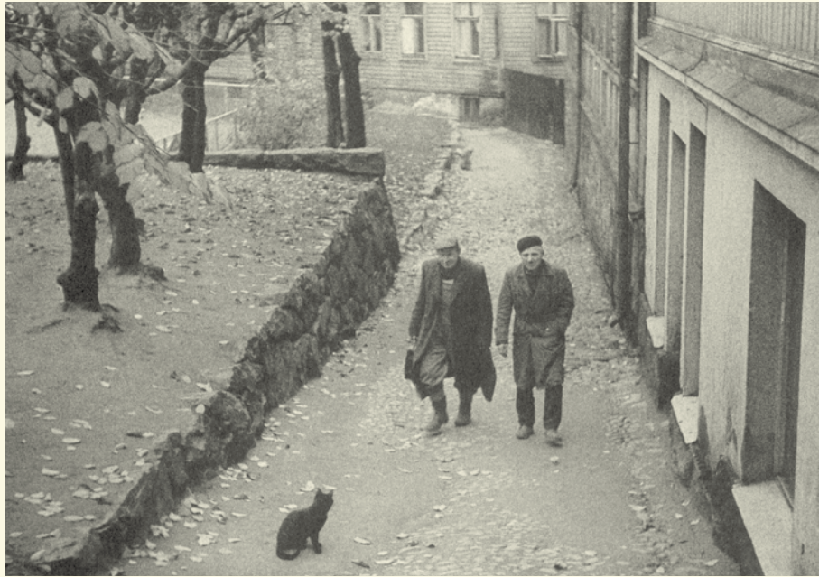
LAPINLAHDENKATU, KAMPPI, 1965 / PENTTI SAMMALLAHTI