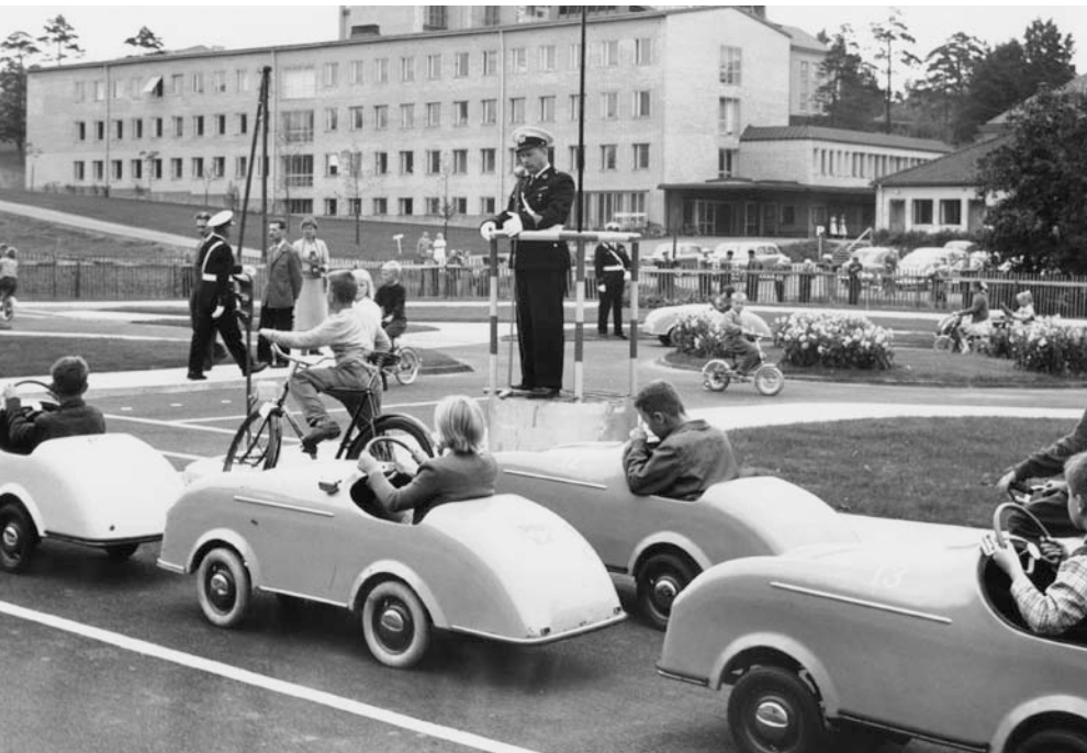
Lasten liikennekaupunki Laaksossa on rakennettu vuonna 1958 ja sen peruskorjaus on valmistunut vuonna 2006