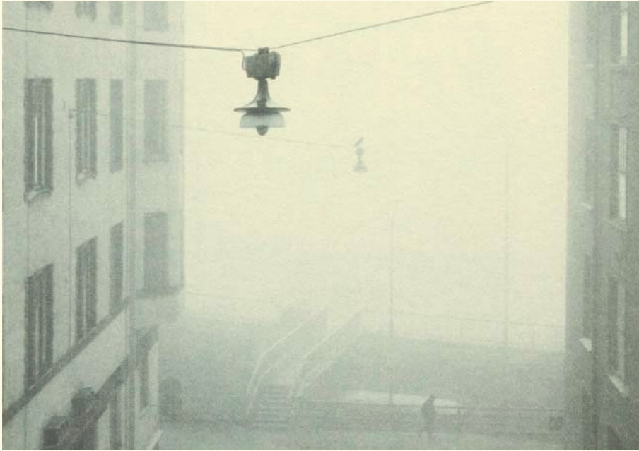
VÄLIKATU, KRUUNUHAKA, 1981 / PENTTI SAMMALLAHTI