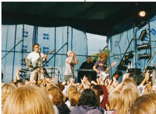
Rasmusen konsertti järjestettiin kirkkonummelaisten yrittäjien tuella

Man utmanade organisationer och företagare i Kyrkslätt och övriga förvaltningar i kommunen att delta. Biblioteket var först att ta emot samarbetsutmaningen och Konstens Natt på biblioteket blev en del av programhelheten under Kyrkslätt dagarna.