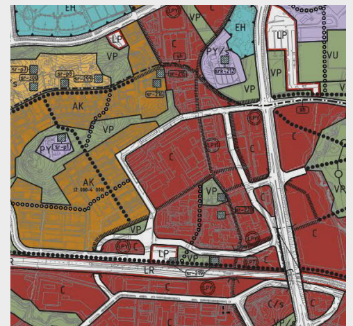
Kuntakeskuksen 1. vaiheen osayleiskaava