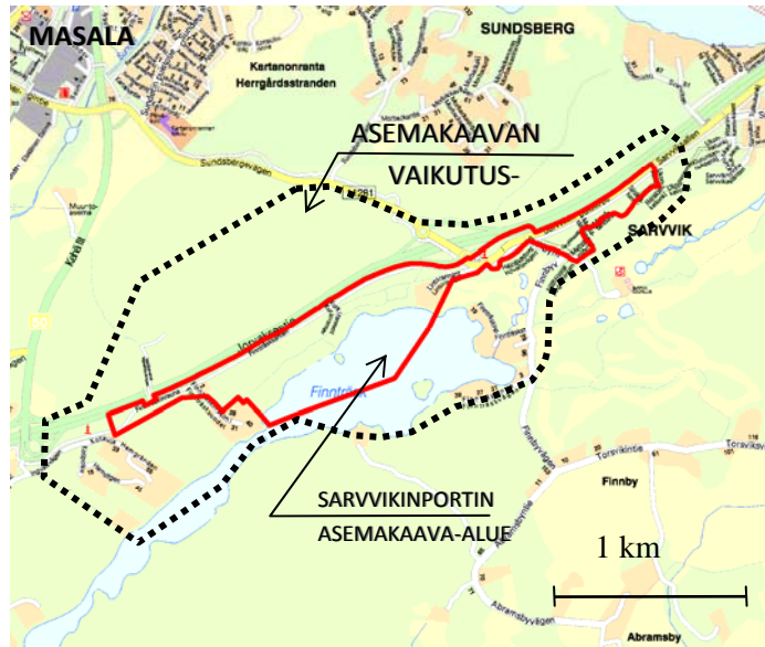
Asemakaava-alueen ja sen vaikutusalueen alustava rajaus

Osallistumis- ja arviointisuunnitelma (MRL 62 § ja 63 §)