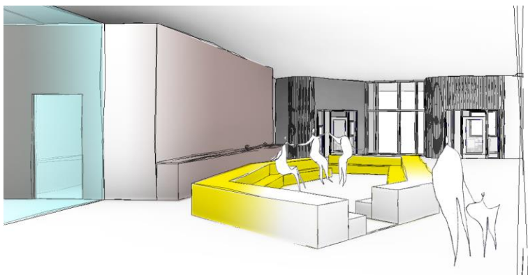
Näkymä 'istuinpesän' ohi päätyjulkisivun suuntaan