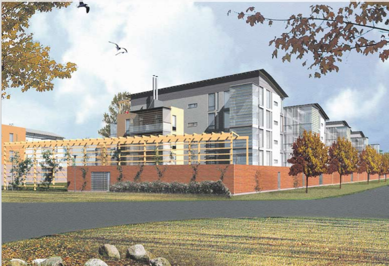
Ervastintien alue rakennetaan niin, että uusi kortteli sopii mahdollisimman hyvin nykyiseen kulttuuriympäristöön. Kaavoitusvaiheessa tehty havainnekuva ei tosin anna aivan lopullista kuvaa uudisrakentamisesta. Näkymä etelästä.